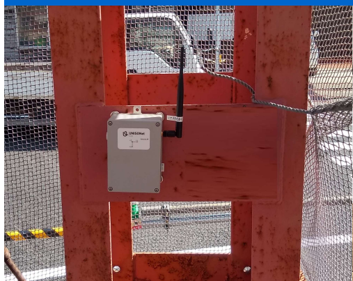
ベントの傾斜監視